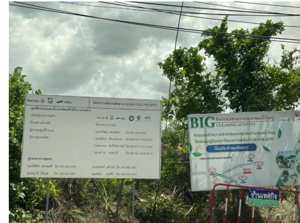
รูปที่ 2-21 ป้ายประชาสัมพันธ์โครงการ