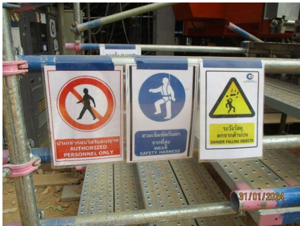
รูปที่ 2-29 ป้ายเตือนเขตอันตรายห้ามเข้าสำหรับผู้ที่ไม่เกี่ยวข้อง