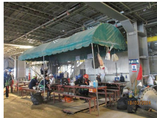
รูปที่ 2-38 ที่พักร้อนในช่วงหยุดพัก