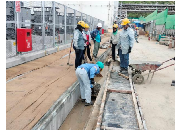
รูปที่ 2-14 การทำความสะอาดรางระบายน้ำและขุดลอกตะกอนดิน