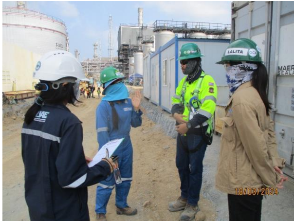
รูปที่ 2-1 หน่วยงานกลางเข้ามาดำเนินการติดตามตรวจสอบ