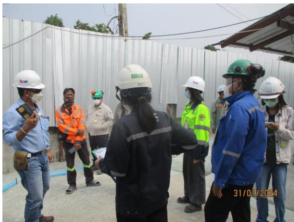
รูปที่ 2-45 การตรวจสอบที่พนักงาน