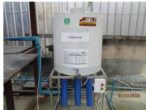
รูปที่ 2-46 น้ำดื่ม (บ้านพนักงาน)