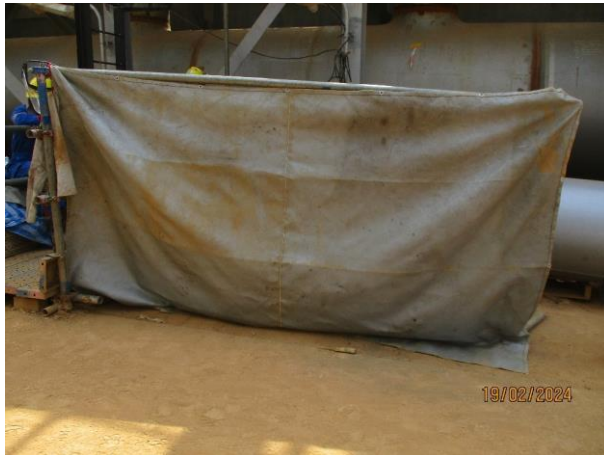
รูปที่ 2-4 การปิดคลุมด้วยผ้าใบทุกด้านเพื่อป้องกัน Copper slag พุ้งออกจากพื้นที่ปฏิบัติงาน