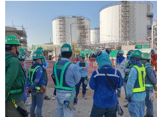
รูปที่ 2-16 การประชุมชี้แจงการทำงานอย่างปลอดภัยก่อนเริ่มปฏิบัติงาน