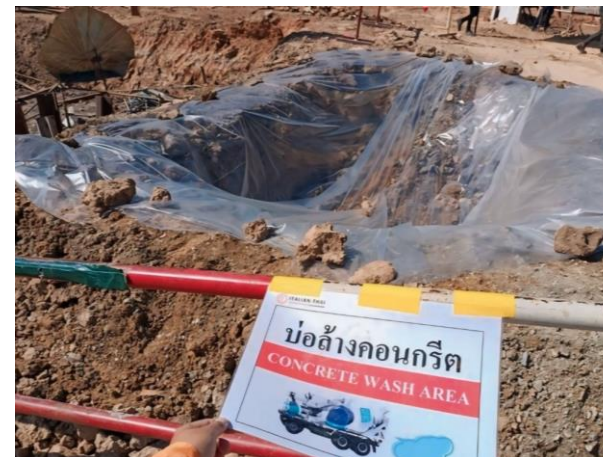
รูปที่ 2-11 บ่อพักรวบรวมตะกอนคอนกรีต