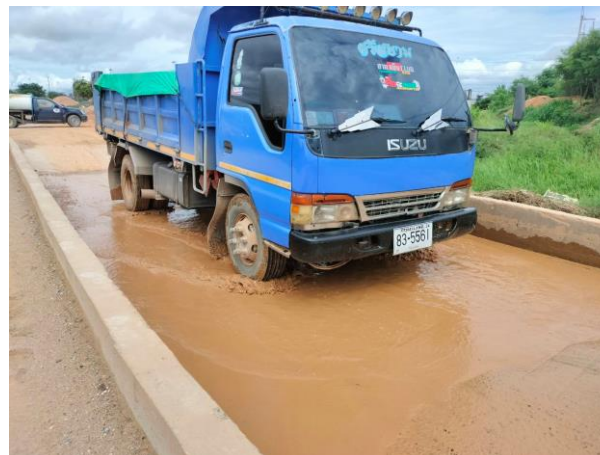
รูปที่ 2-6 ที่ล้างล้อรถบรรทุก