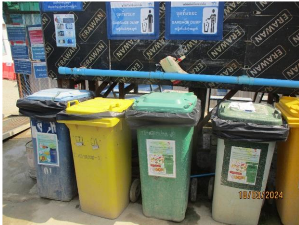
รูปที่ 2-17 ภาพของถังขยะแยกตามประเภท