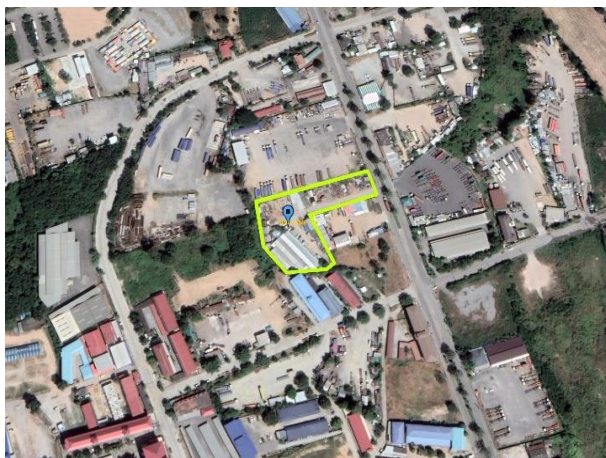
รูปที่ 2-43 พิกัดที่ปักคนงาน