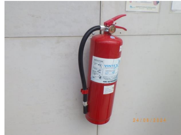
รูปที่ 2-49 ถังดับเพลิง (ที่พักคนงาน)