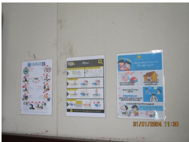
รูปที่ 2-44 (ต่อ) ป้ายประชาสัมพันธ์ด้านสุขภาพและป้องกันโรคติดต่อ