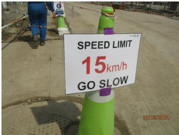
รูปที่ 2-19 ป้ายจำกัดความเร็วของรถในพื้นที่ก่อสร้าง