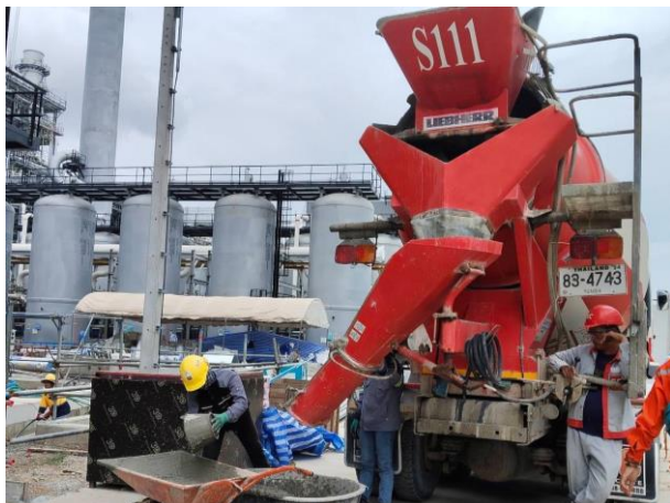
รูปที่ 2-10 การทำความสะอาดรางระบายคอนกรีตของรถชนคอนกรีต