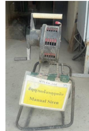
รูปที่ 2-42 สัญญาณเตือนภัย