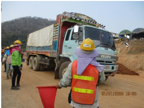
รูปที่ 2-22 เจ้าหน้าที่ดูแลรถที่เข้า-ออกพื้นที่ก่อสร้าง