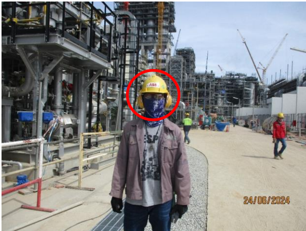
รูปที่ 2-31 การสวมใส่อุปกรณ์ลดเสียงและป้ายเตือนให้สวมใส่อุปกรณ์ลดเสียง