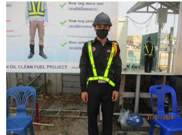
รูปที่ 2-30 เจ้าหน้าที่รักษาความปลอดภัย