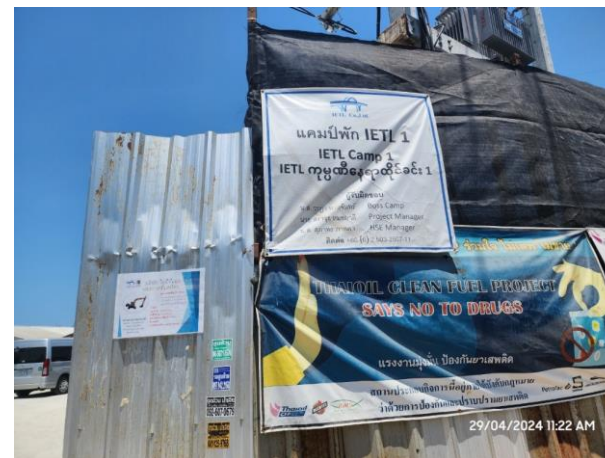
รูปที่ 2-51 บ้ายประชาสัมพันธ์หน้าที่พักคนงาน