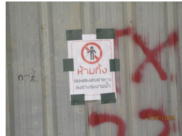
รูปที่ 2-15 ป้ายห้ามทิ้งขยะลงรางระบายน้ำ