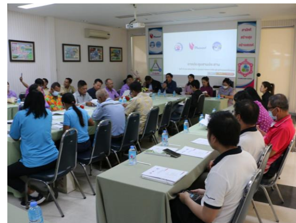
รูปที่ 2-53 การประชุมสามประสาน