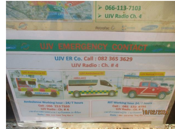
รูปที่ 2-34 ป้ายแสดงหมายเลขโทรศัพท์ของหน่วยงานที่เกี่ยวข้อง เพื่อขอความช่วยเหลือในกรณีเกิดเหตุฉุกเฉิน