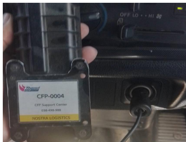
รูปที่ 2-26 การติดตั้งระบบ Global Positioning System (GPS)