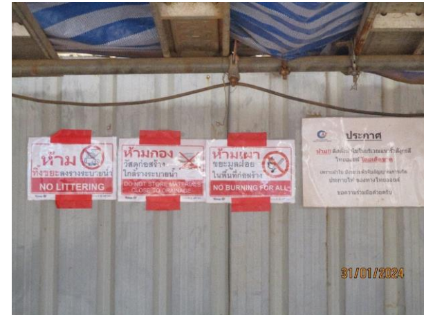
รูปที่ 2-18 ป้ายห้ามเผาขยะในพื้นที่ก่อสร้าง