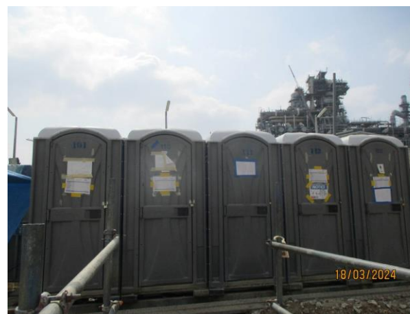
รูปที่ 2-9 ห้องน้ำ ห้องส้วม พร้อมระบบบำบัดน้ำเสียสำเร็จรูปแบบเคลื่อนที่