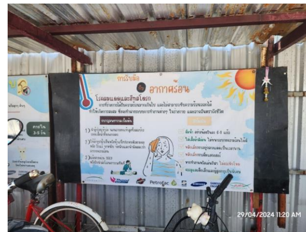
รูปที่ 2-44 ป้ายประชาสัมพันธ์ด้านสุขภาพและป้องกันโรคติดต่อ