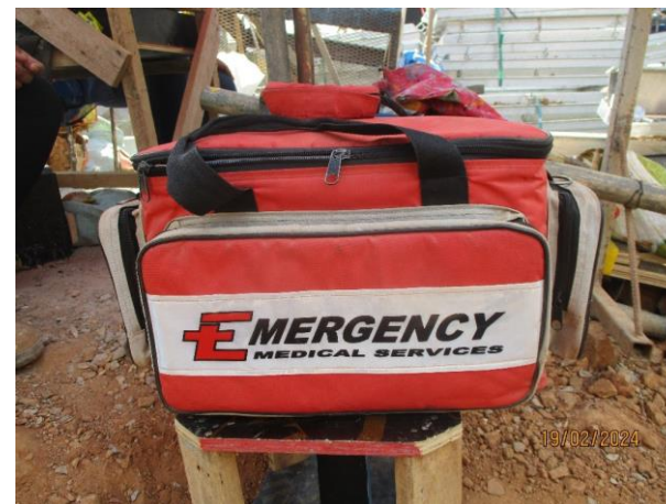
รูปที่ 2-36 อุปกรณ์ปฐมพยาบาลเบื้องต้น