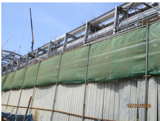
รูปที่ 2-8 แนวรั้วเขตพื้นที่ก่อสร้าง