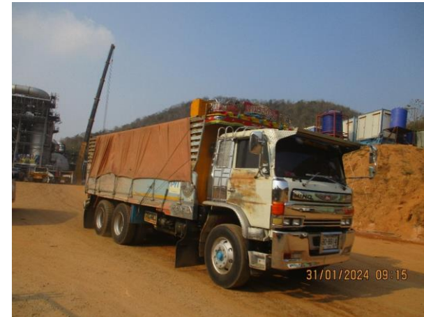
รูปที่ 2-5 การใช้ผ้าใบปิดคลุมส่วนบรรทุกของรถบรรทุก