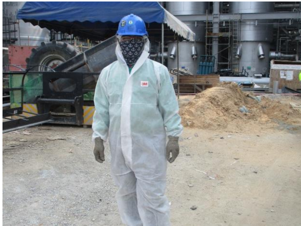
รูปที่ 2-32 การสวมใส่อุปกรณ์คุ้มครองความปลอดภัยส่วนบุคคลตามลักษณะงาน