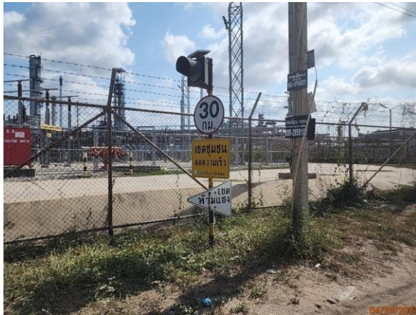
รูปที่ 2-20 ป้ายจำกัดความเร็วของรถในเขตชุมชน