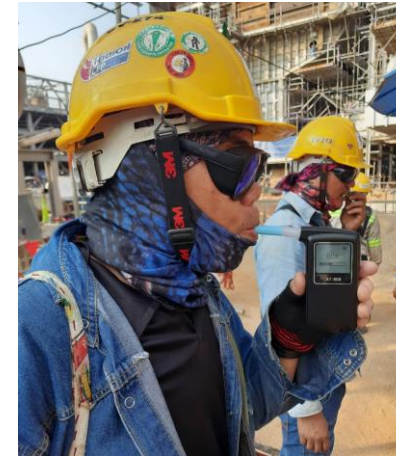
รูปที่ 2-40 การตรวจวัดแอลกอฮอล์