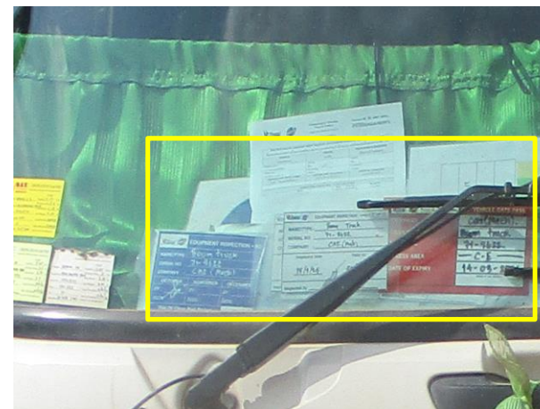
รูปที่ 2-25 บ้ายชื่อแสดงหน่วยงานสังกัดที่รับผิดชอบ พร้อมหมายเลขโทรศัพท์ ที่รถขนส่งคนงานและอุปกรณ์ก่อสร้าง