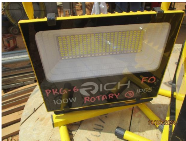
รูปที่ 2-35 ไฟฟ้าส่องสว่างฉุกเฉิน