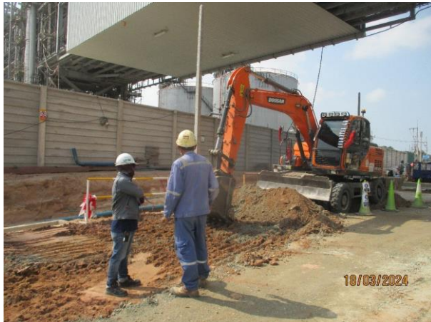
รูปที่ 2-33 หัวหน้างานควบคุมการทำงาน