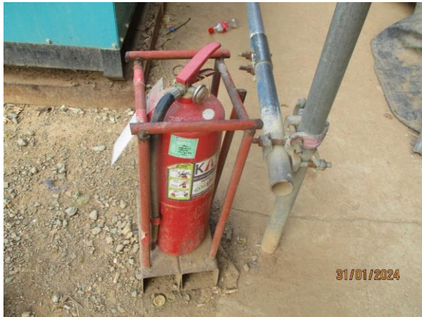
รูปที่ 2-41 ถังดับเพลิง