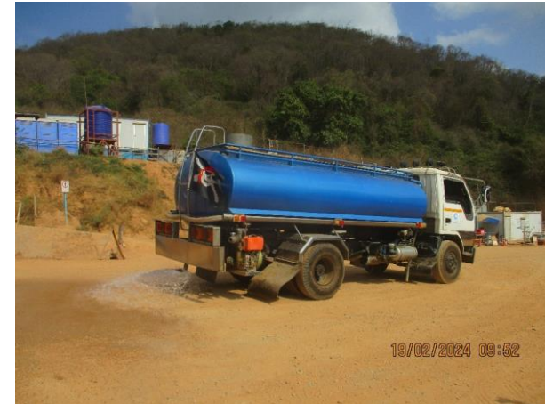
รูปที่ 2-2 การฉีดพรมน้ำป้องกันฝุ่นละออง