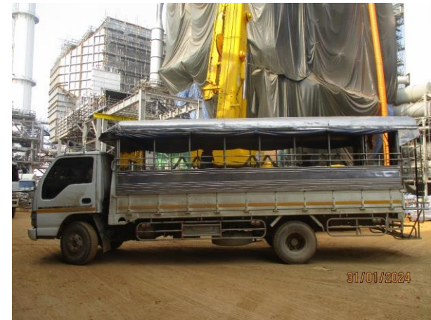
รูปที่ 2-23 รถรับ-ส่งคนงาน