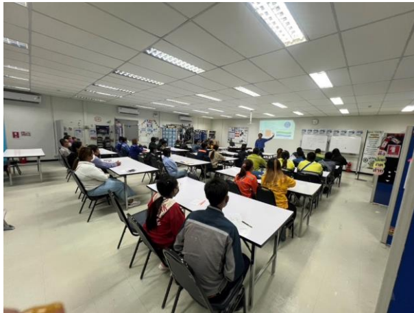
รูปที่ 2-27 การอบรมก่อนเข้าทำงาน