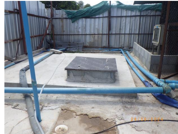
รูปที่ 2-48 ห้องน้ำ ห้องส้วม ที่ติดตั้งระบบบำบัดน้ำเสีย (บ้านพักคนงาน)