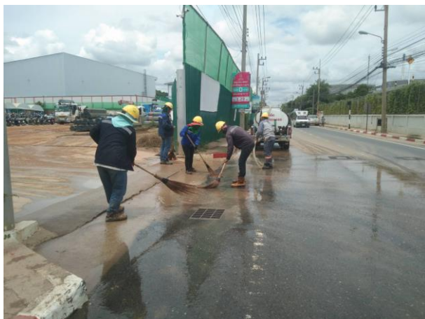
รูปที่ 2-52 ผู้รับเหมาก่อสร้างทำความสะอาดถนนบริเวณบ้านพัก