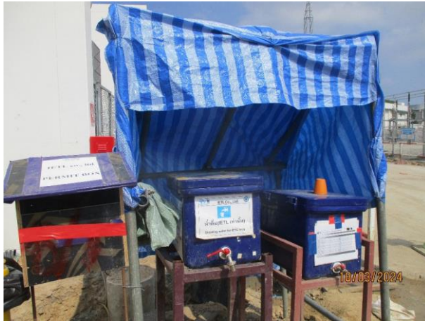
รูปที่ 2-39 น้ำดื่ม