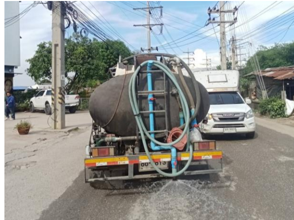
รูปที่ 2-3 การทำความสะอาดถนนชุมชน