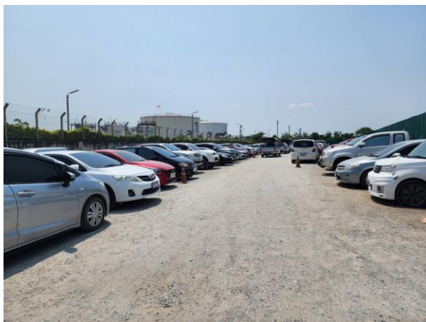
รูปที่ 2-24 พื้นที่จอดรถรับ-ส่งคนงาน