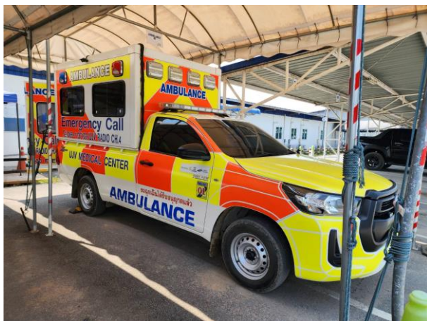
รูปที่ 2-37 รถพยาบาลภายในพื้นที่สำนักงานสนาม