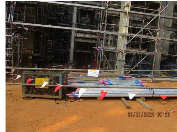
รูปที่ 2-13 พื้นที่จัดเก็บวัสดุก่อสร้าง