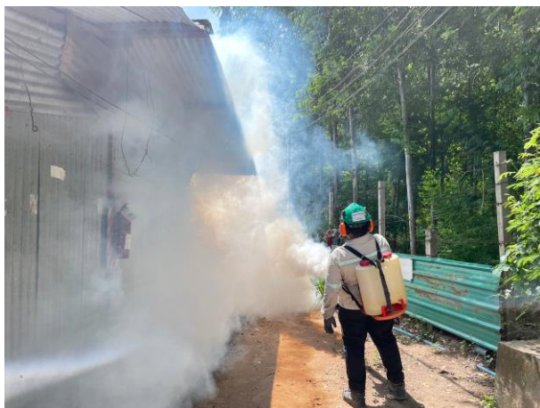
รูปที่ 2-50 การฉีดพ่นยุง (ที่พักคนงาน)