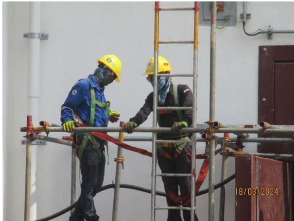
รูปที่ 2-32 (ต่อ) การสวมใส่อุปกรณ์คุ้มครองความปลอดภัยส่วนบุคคลตามลักษณะงาน