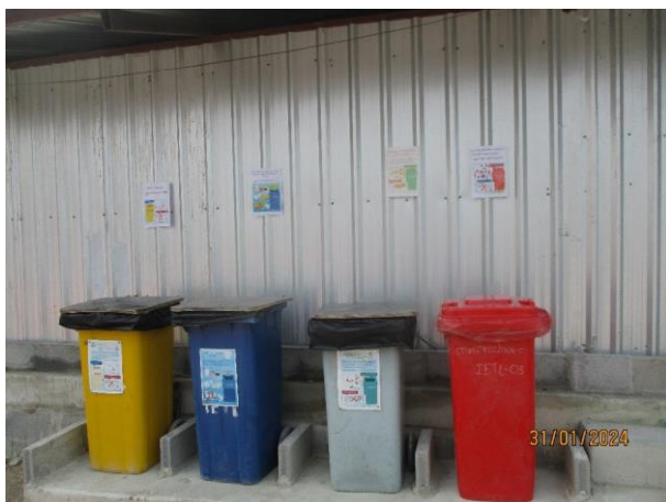
รูปที่ 2-47 ภาชนะรองรับของเสียแยกตามประเภท (บ้านพนักงาน)