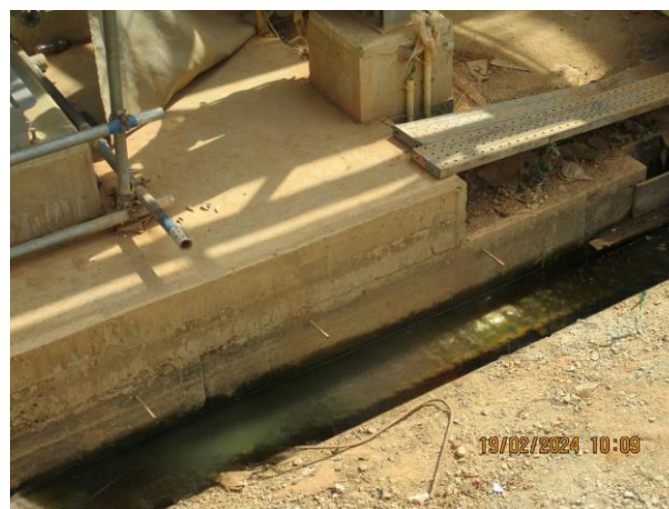
รูปที่ 2-12 รางระบายน้ำชั่วคราว