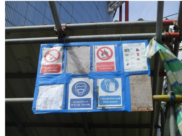
รูปที่ 2-28 ป้ายสัญลักษณ์เกี่ยวกับความปลอดภัยอาชีวอนามัย